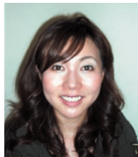
変身したモデルさんです